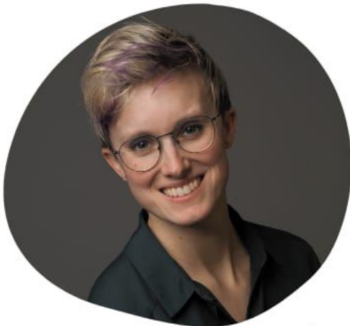
Astrid ist Sexualpädagogin, psychosoziale Beraterin und Schriftstellerin.

Es werden 5h Gruppensupervision bestätigt.